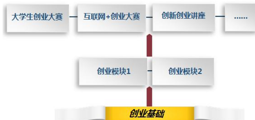
图2 创新创业课程体系建设思路